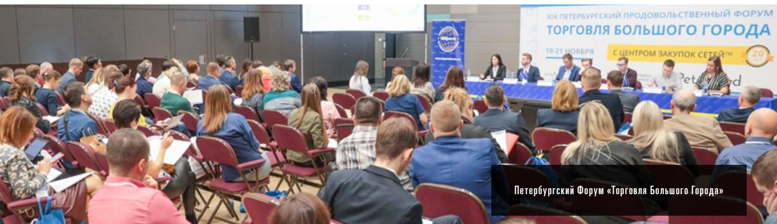
Петербургский Форум «Торговля Большого Города»