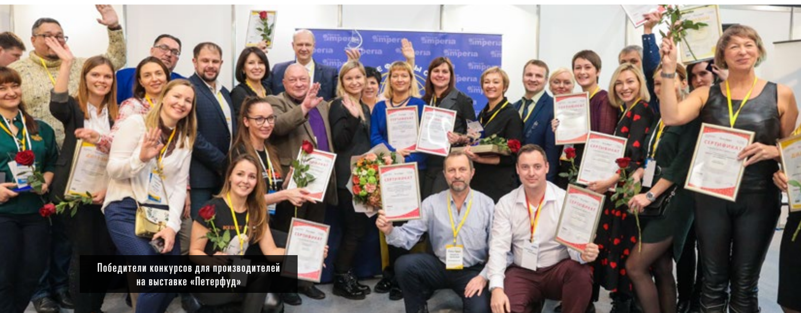
Победители конкурсов для производителей на выставке «Петерфуд»