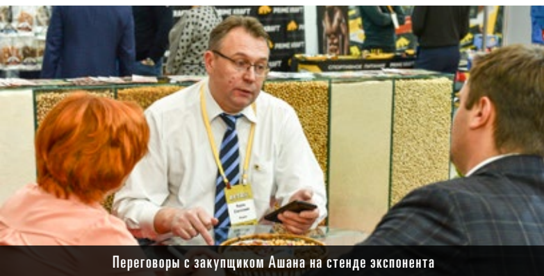
Переговоры с закупщиком Ашана на стенде экспонента

Превратите деловые контакты в дружеские связи. Театральный фуршет закупщиков сетей, экспонентов выставки и делегатов Форума «Торговля Большого Города»