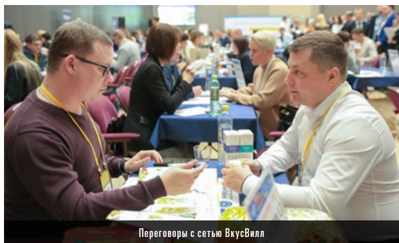
Переговоры с сетью ВкусВилл