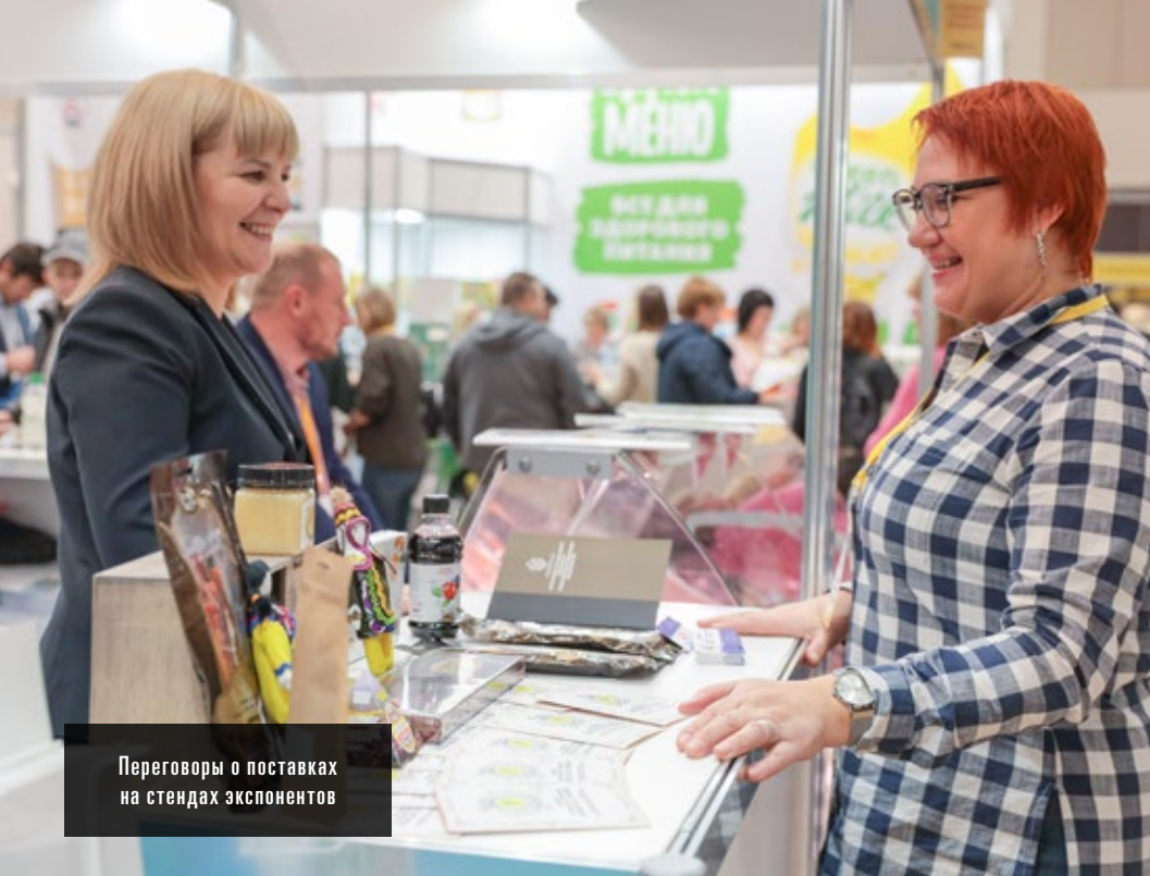
Переговоры о поставках на стендах экспонентов