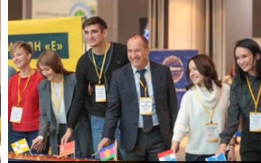
Руководители комитетов 28 регионов РФ разрезают праздничный пирог в честь открытия выставки