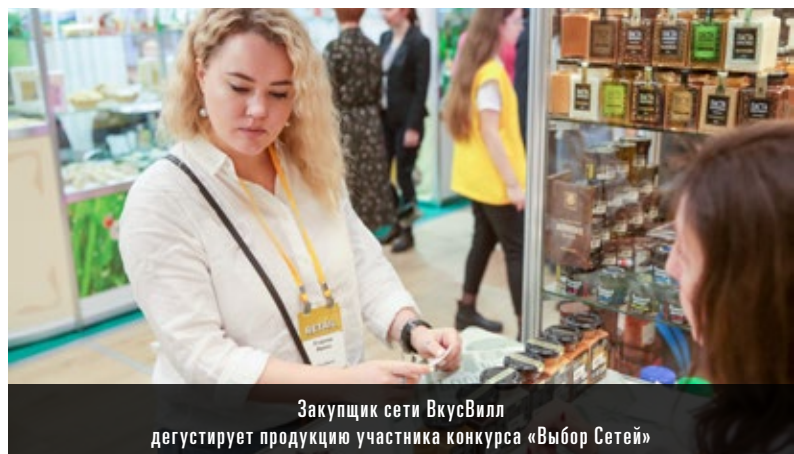
Закупщик сети ВкусВилл дегустирует продукцию участника конкурса «Выбор Сетей»