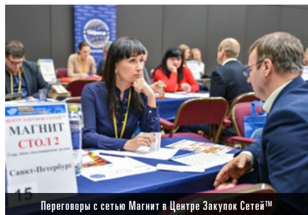
Переговоры с сетью Магнит в Центре Закупок Сетей™