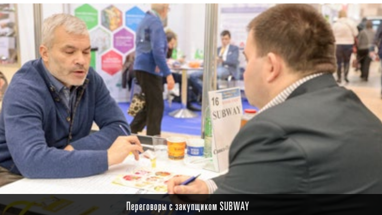
Переговоры с закупщиком SUBWAY

Впервые Центр Закупок Сетей™: HoReCa был организован на выставке ПЕТЕРФУД-2019, в котором приняли участие закупщики таких компаний как: SUBWAY, Теремок, Буше, Суши Wok, Токио Сити, Бахрома, Баскин Роббинс и другие.