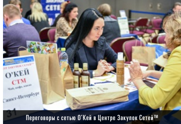
Переговоры с сетью О'Кей в Центре Закупок Сетей™