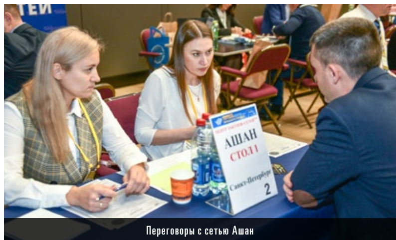
Переговоры с сетью Ашан