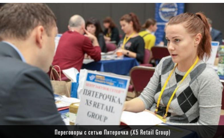
Переговоры с сетью Пятерочка (X5 Retail Group)