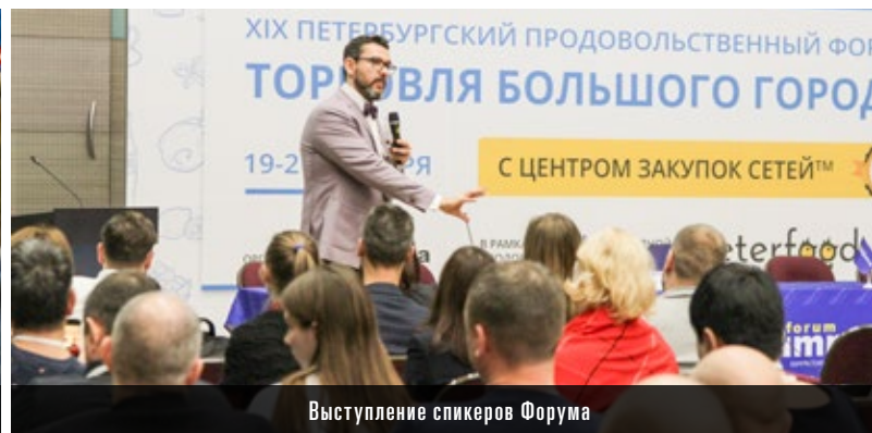
Выступление спикеров Форума