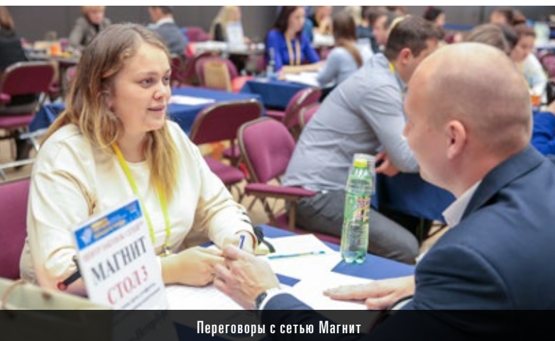
Переговоры с сетью Магнит