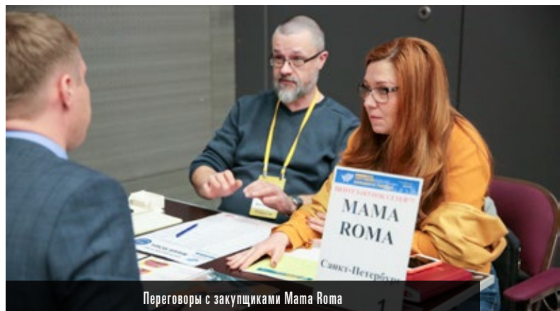
Переговоры с закупщиками Mama Roma