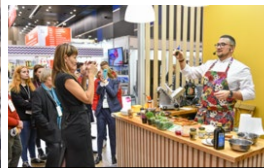
Кулинарные мастер-классы от ТВ-звезд