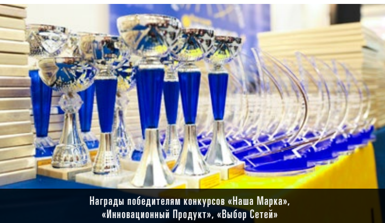
Награды победителям конкурсов «Наша Марка», «Инновационный Продукт», «Выбор Сетей»

Участие в конкурсах поможет продвинуть Вашу продукцию в федеральные и региональные сети и увеличить доверие потребителей.