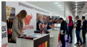
«Биржа франшиз» 2020

МЕЖДУНАРОДНАЯ ВЫСТАВКА ДЛЯ ПРОФЕССИОНАЛОВ РЕСТОРАННО-ГОСТИНИЧНОЙ ОТРАСЛИ