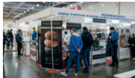
Коллективный стенд региона со стандартной застройкой