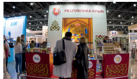
Коллективный стенд региона с индивидуальной застройкой

Количество предприятий, ставших экспонентами ПИР Экспо при финансовой поддержке различных государственных организаций (по годам):