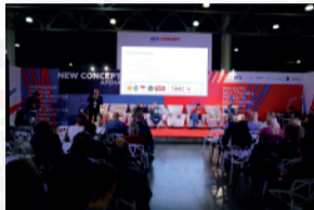
«HoReCa Investment Forum» 2020